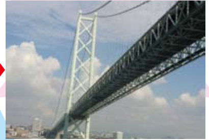
なんと！明石大橋でした！！ 橋の下をくぐって進んでゆきます★