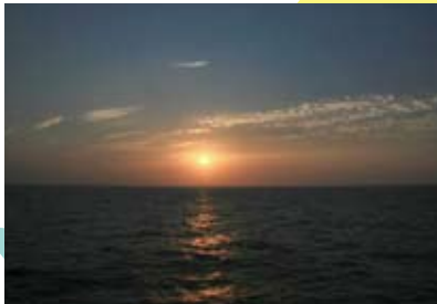
綺麗な夕日にうっとり(*^▽^*)