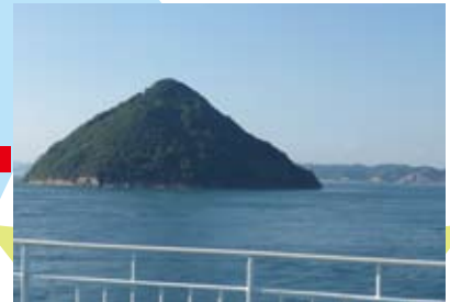
瀬戸内海に浮かぶ三角の島★