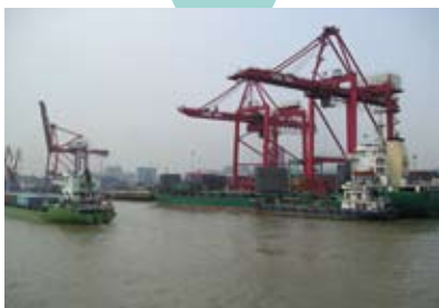
黄浦江ではたくさんの貨物船とすれ違い ながら進みます(▽^*)♪