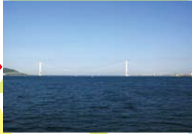
出港後、一時間もすると遠くに橋が。