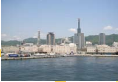
さあ、これから上海へ向けて 出発ですo(*^▽^*)o♪