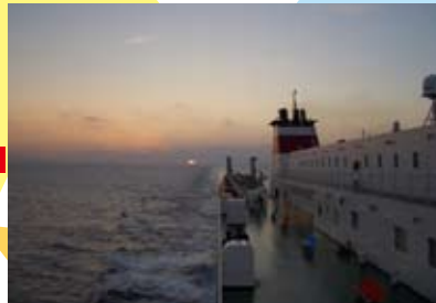
晴れていれば、デッキから 素敵な夕日を見ることができます★